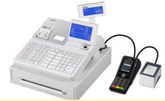
ブルレジ+V200c+QRリーダー

レジ売上登録⇒小計の後、 電子決済（クレカ・電子マネー・QR）の場合、信用キーを使用します。